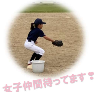
女子仲間待ってます!